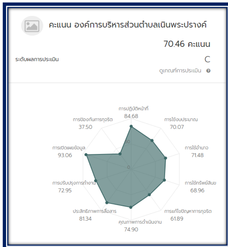
รูปภาพที่ ๑

จากผลการประเมิน ITA ในปีงบประมาณ พ.ศ. ๒๕๖๔ ขององค์การบริหารส่วนตำบลเนินพระปรางค์ มีผลคะแนน ๗๐.๔๖ คะแนน ระดับผลการประเมิน อยู่ในระดับ C